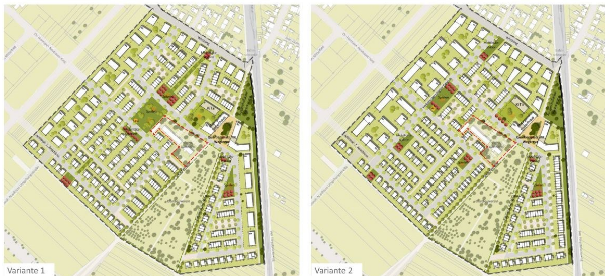
Abbildung 4: Konzeptentwicklung - Zwei Entwicklungskonzepte, aus: Dokumentation des städtebaulichen Entwurfs, Stand: 24.02.2020

Variante 1 sah eine Dichte von etwa 37 Wohnungen je Hektar, zwei Anschlüsse an den Westring und einen großen Quartierspark vor, der diverse Erholungsangebote zentral im Quartier bündelt. Variante 2 sah eine Dichte von etwa 47 Wohnungen je Hektar, nur einen Anschluss an den Westring und ein Grünkonzept mit kleinen sogenannten „Pocket Parks“ anstatt eines großen zusammenhängenden Grünzugs vor.