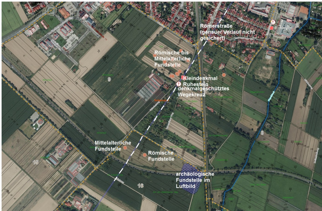
Abbildung 3: Kartierung der bekannten Bodendenkmäler im Geltungsbereich des B-Plans (Voreinschätzung)

Auf der Grundlage dieses Gutachtens und einer ergänzenden Überprüfung durch Suchschnitte findet eine Abgrenzung der Bodendenkmäler statt, die im Nachgang durch eine archäologische Untersuchung vor einer Umsetzung der Überbauung untersucht werden. Der konkrete Umfang der Untersuchung wird durch eine denkmalrechtliche Genehmigung nach § 18 Abs. 1 HDSchG geregelt. In den Bebauungsplan wird ein entsprechender Passus für den vorliegenden Vorgang in die Hinweise (unter C Hinweise – Ziff. 1 - Bodendenkmäler) aufgenommen.