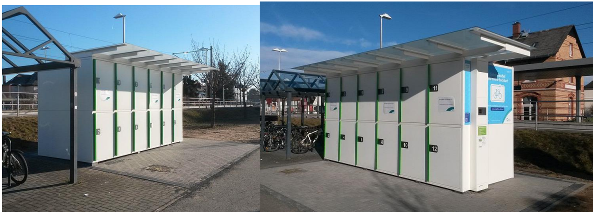
Beispiel vom S-Bahnhof Rodgau-Jügesheim

Begründung: Für die Mobilitätswende ist es zwingend erforderlich, die Nutzung der öffentlichen Verkehrsmittel und des Fahrrades zu stärken. Um die Attraktivität des Fahrrades zu stärken, sollten altstadtnah Möglichkeiten geschaffen werden, das eigene Fahrrad sicher abstellen zu können. Zudem bietet eine Bike and Ride Station mit E-Bike Lademöglichkeit neue Möglichkeiten für Pendler. Diese Stationen an den Parkdecks zu platzieren schafft Anreize für Fahrgemeinschaften bei niedrigem Parkraumbedarf.