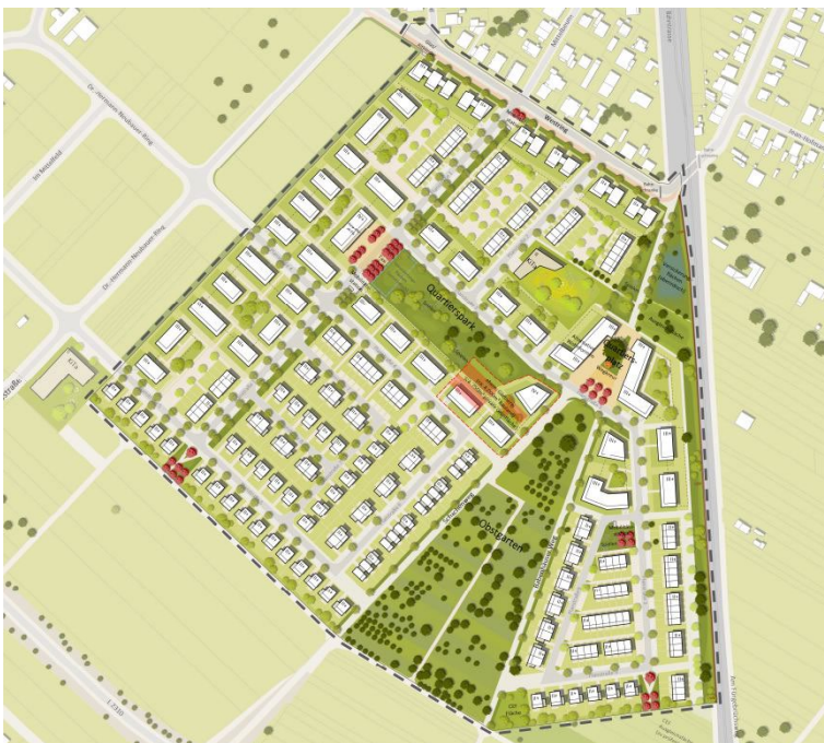
Abbildung 5: Städtebaulicher Entwurf – Rahmenplan, Stand: 24.02.2020

Der Rahmenplan wurde auf Basis der Variante 1 und der genannten zusätzlichen Aspekte ausgearbeitet und zu einem umsetzungsfähigen Entwurf gebracht. Auf dieser Grundlage des Rahmenplans vom Februar 2020 wurde der Bebauungsplan erarbeitet und zweimal ausgelegt. Im Rahmen dieser Offenlegungen wurden jedoch Stellungnahmen zum Artenschutz vorgebracht, die in einem absehbaren Zeitrahmen nicht im Bebauungsplanverfahren abzarbeiten waren. Diese Hinweise aus den Stellungnahmen betrafen ausschließlich die Entwicklung des südöstlichen Bereichs des Plangebiets. Da in Seligenstadt weiterhin ein hoher Wohnraumbedarf vorliegt und die Entwicklung des westlichen Teils des Plangebiets ohne diesbezüglichen Einschränkungen möglich ist, wurde beschlossen, dass der Bebauungsplan in zwei Teilbereiche (Teil A und B) aufgeteilt wird.