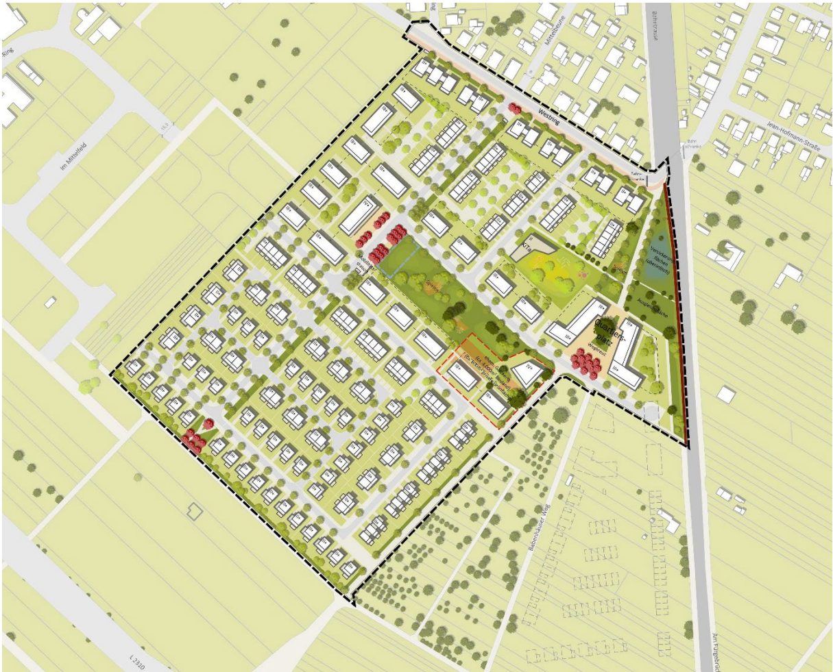
Abbildung 6: Städtebaulicher Entwurf – Rahmenplan – Teilbereich A, Stand: 08.09.2021