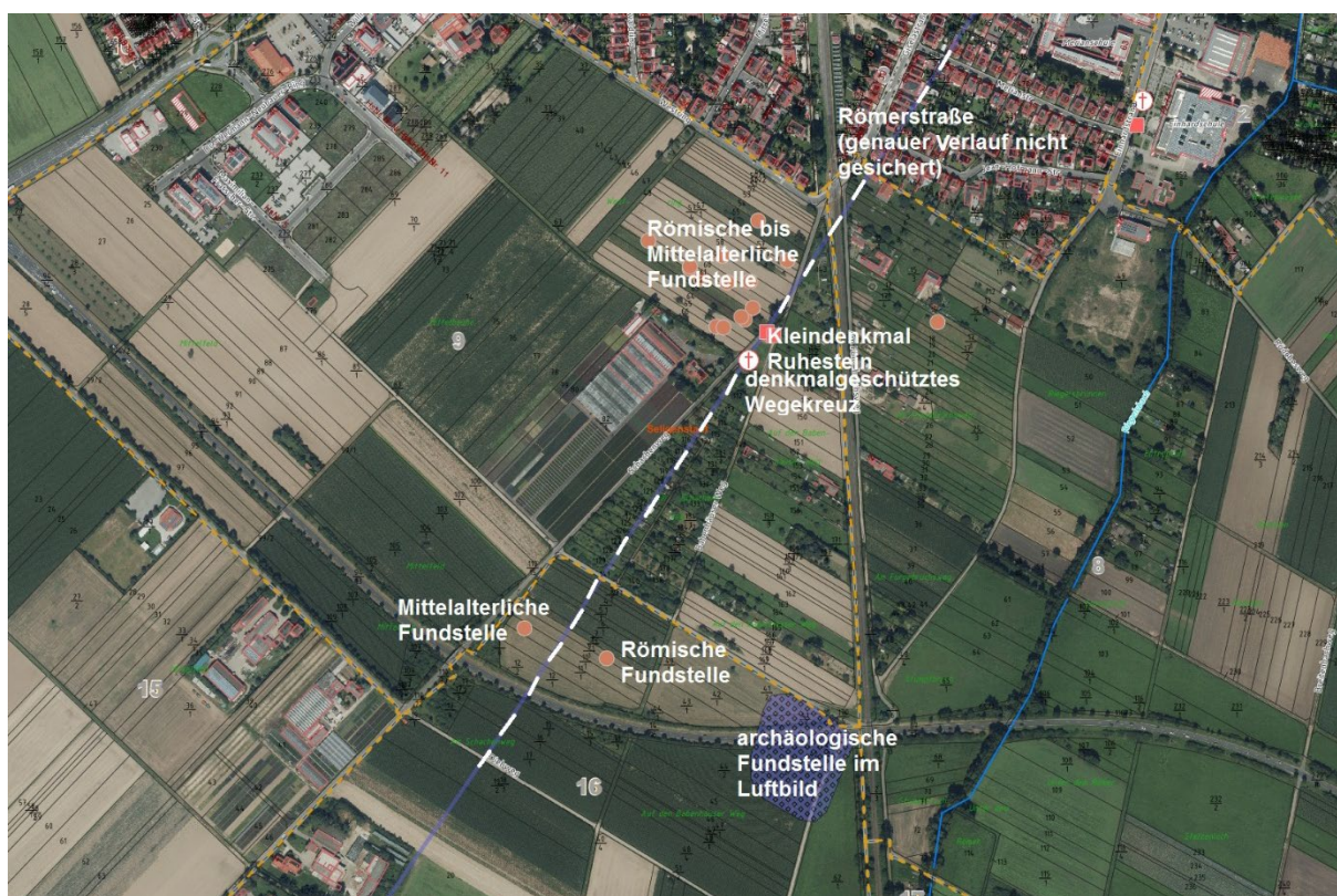
Abbildung 3: Kartierung der bekannten Bodendenkmäler im Geltungsbereich des B-Plans (Voreinschätzung), HessenArchäologie, Email 02.04.2019

Auf der Grundlage dieses Gutachtens und einer ergänzenden Überprüfung durch Suchschnitte findet eine Abgrenzung der Bodendenkmäler statt, die im Nachgang durch eine archäologische Untersuchung vor einer Umsetzung der Überbauung untersucht werden. Der konkrete Umfang der Untersuchung wird durch eine denkmalrechtliche Genehmigung nach § 18 Abs. 1 HDSchG geregelt. In den Bebauungsplan wird ein entsprechender Passus für den vorliegenden Vorgang in die Hinweise (unter C Hinweise – Ziff. 1 - Bodendenkmäler) aufgenommen.