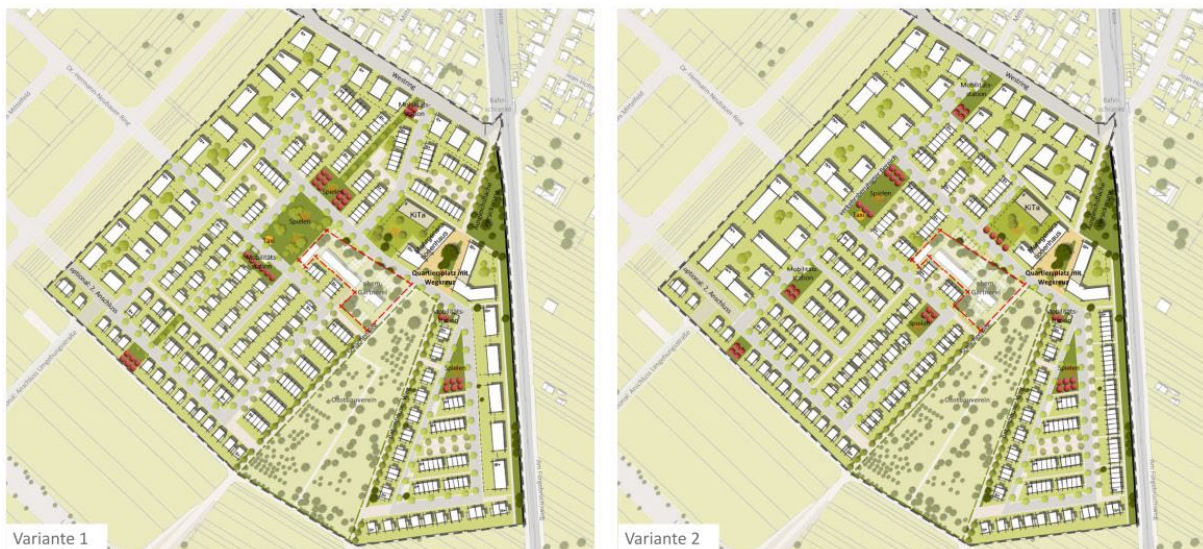
Abbildung 4: Konzeptentwicklung - Zwei Entwicklungskonzepte, aus: Dokumentation des städtebaulichen Entwurfs, Stand: 24.02.2020

Variante 1 sah eine Dichte von etwa 37 Wohnungen je Hektar, zwei Anschlüsse an den Westring und einen großen Quartierspark vor, der diverse Erholungsangebote zentral im Quartier bündelt. Variante 2 sah eine Dichte von etwa 47 Wohnungen je Hektar, nur einen Anschluss an den Westring und ein Grünkonzept mit kleinen sogenannten „Pocket Parks“ anstatt eines großen zusammenhängenden Grünzugs vor.